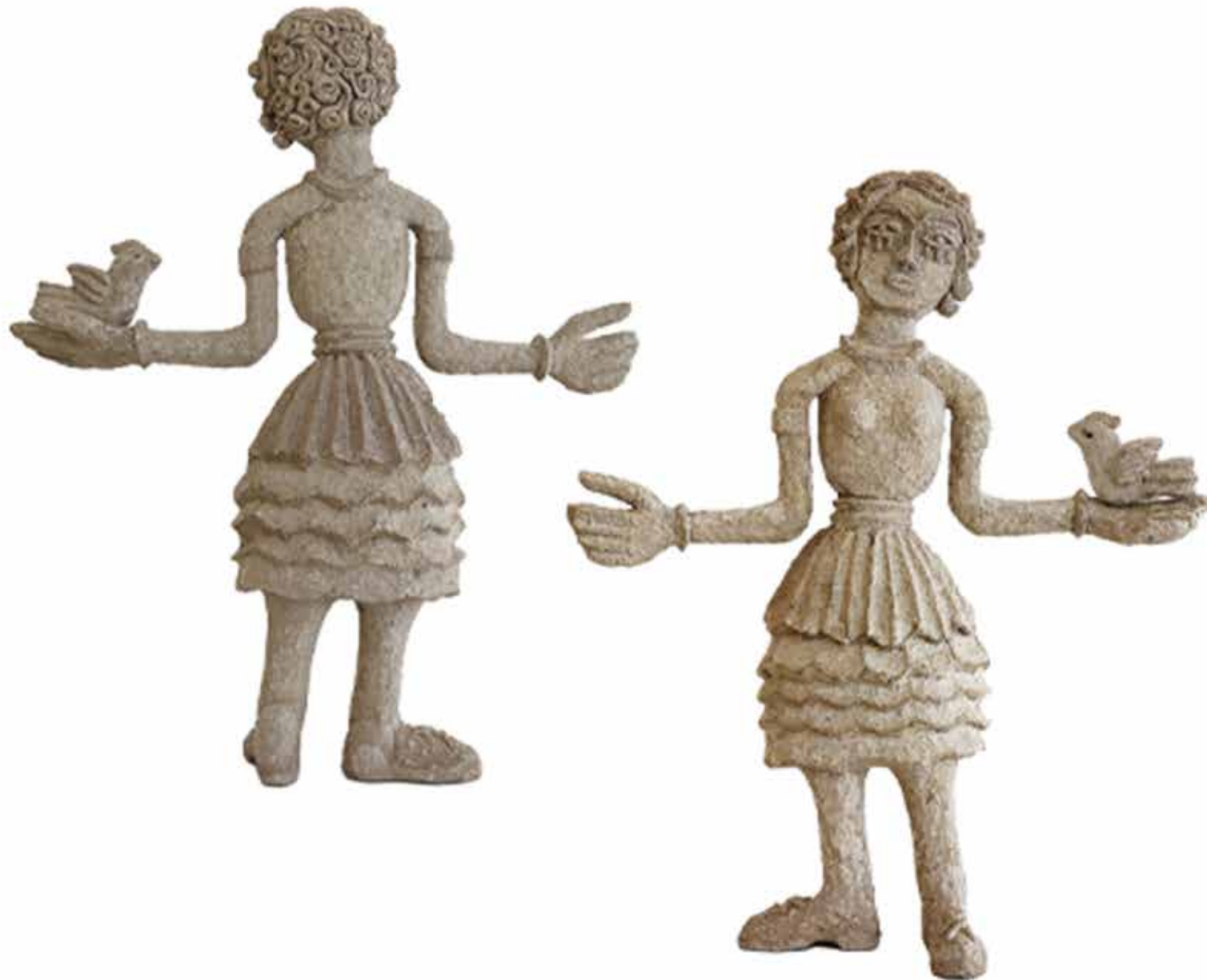
Hajar Jahanbakhsh Instalation Shirin Papermache 65x54x18 cm 2023