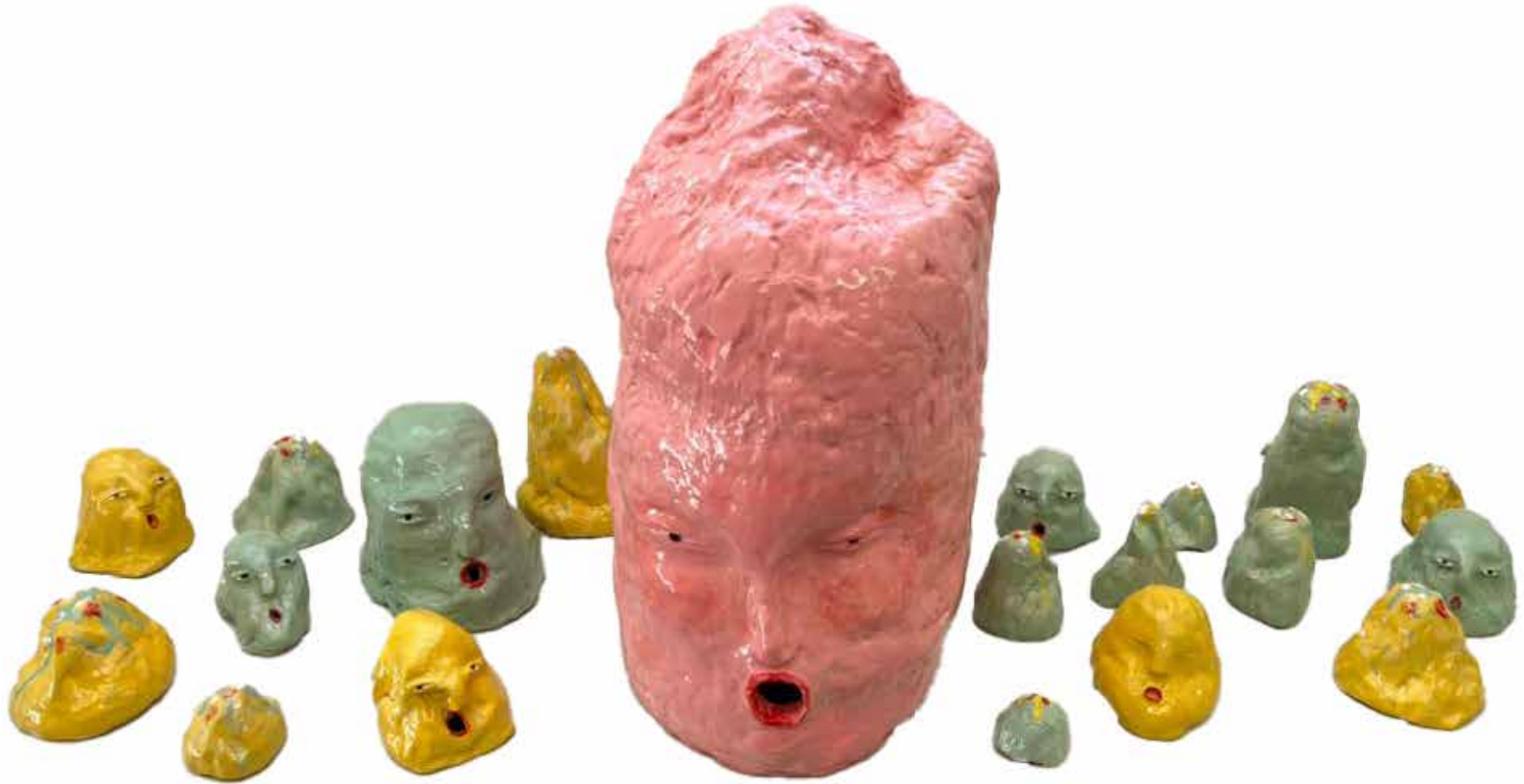
Mona Kalahroodi Untitled Installation Ceramic 2023