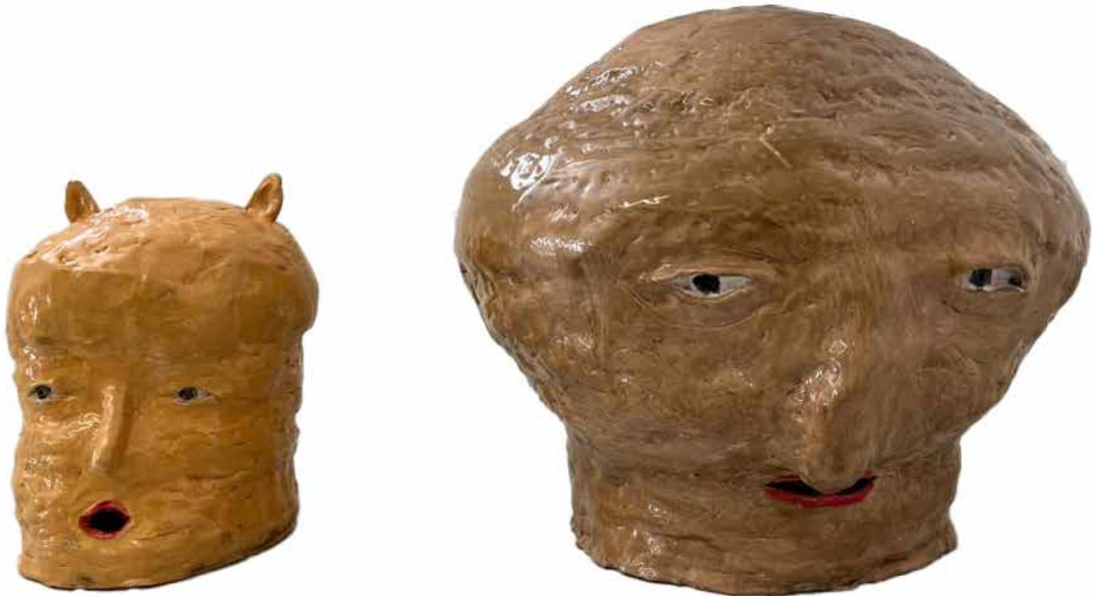
Mona Kalahroodi Untitled Installation Ceramic 2023