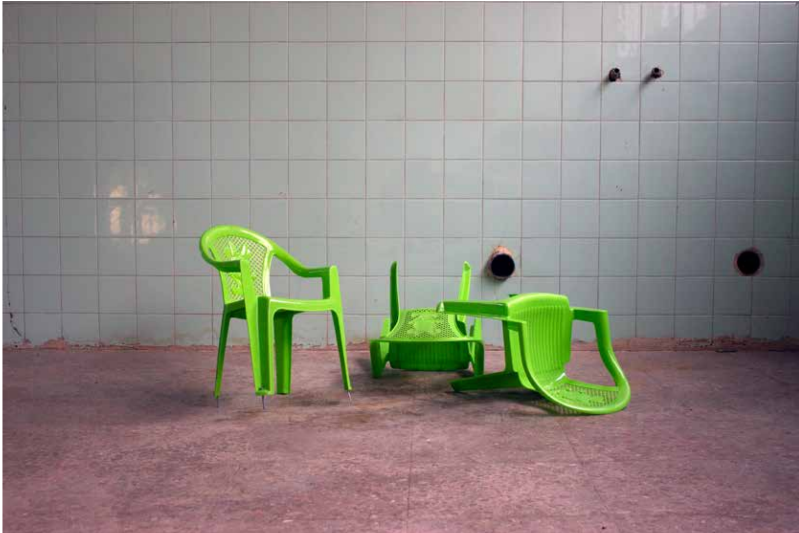
Siavash Hatam Video Installation-Edition 1 of 3 plaything Video and Plastic chair 180x200 cm 2023