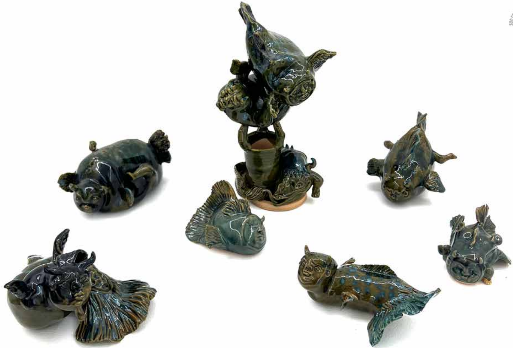
Mohammad Moeini Instalation Crazytures Pottery Clay 2023