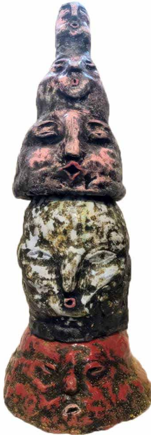
Mona Kalahroodi Untitled Instalation Ceramic 22x22x60 cm 2023