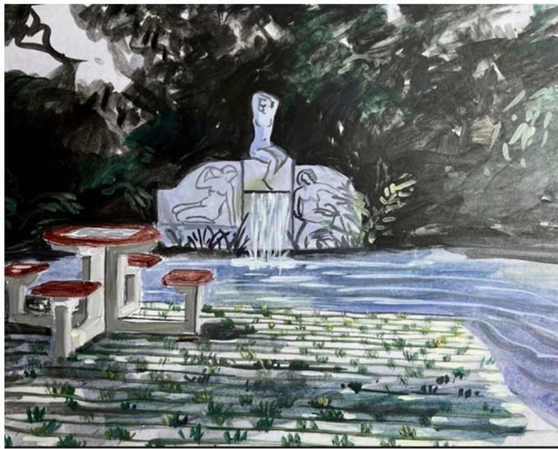
TANNAZ ADLI | UNTITLED | OIL ON CANVAS | 80 * 100 | 2026