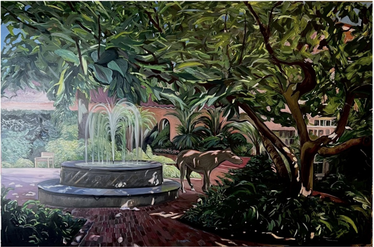
TANNAZ ADLI | UNTITLED | OIL ON CANVAS | 100 * 150 | 2026