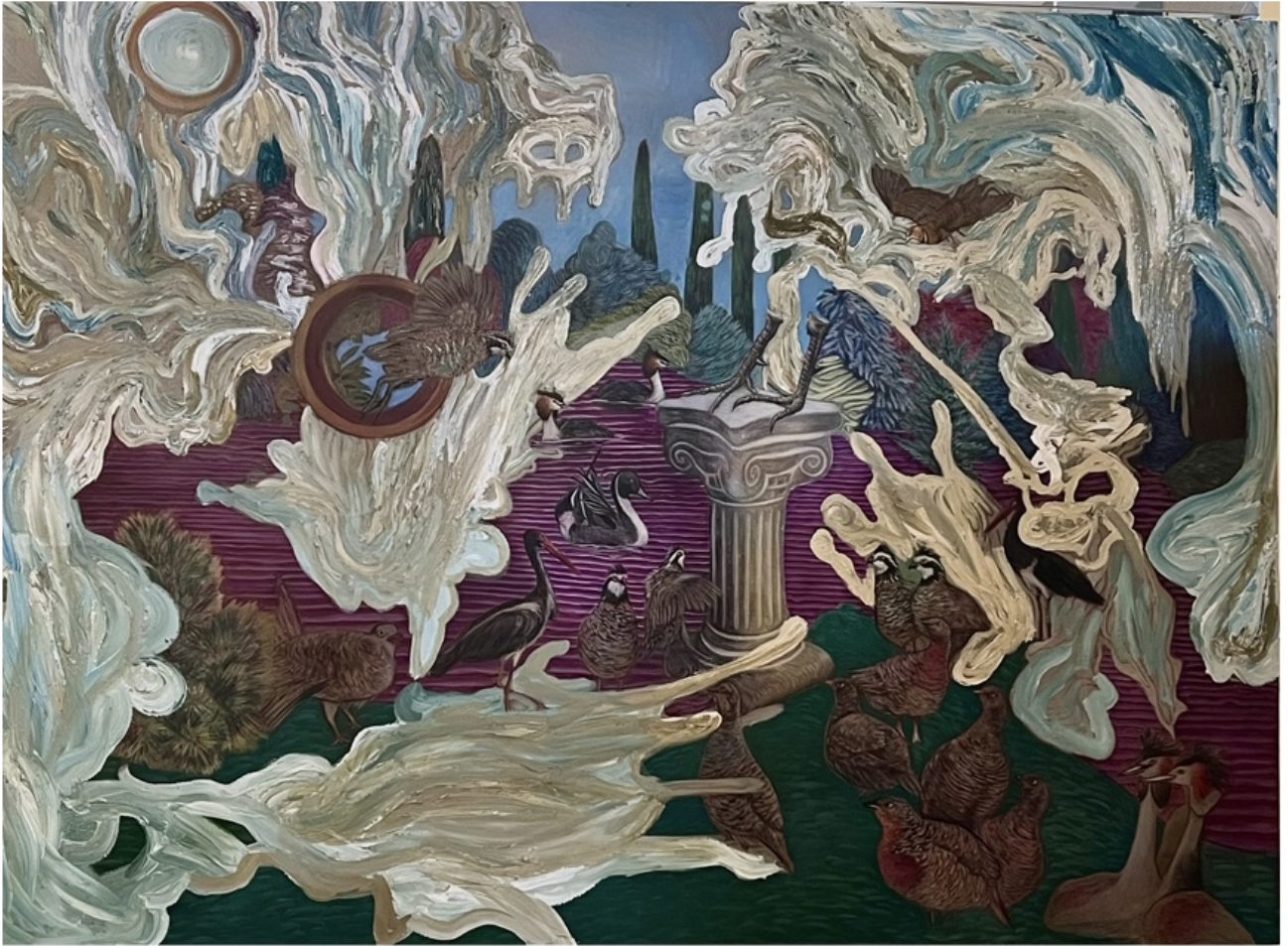
TANNAZ ADLI | UNTITLED | OIL ON CANVAS | 110 * 150 | 2026