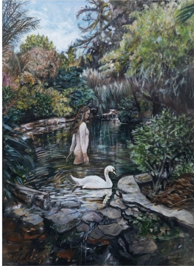
TANNAZ ADLI | UNTITLED | OIL ON CARDBOARD | 40 * 30 | 2026