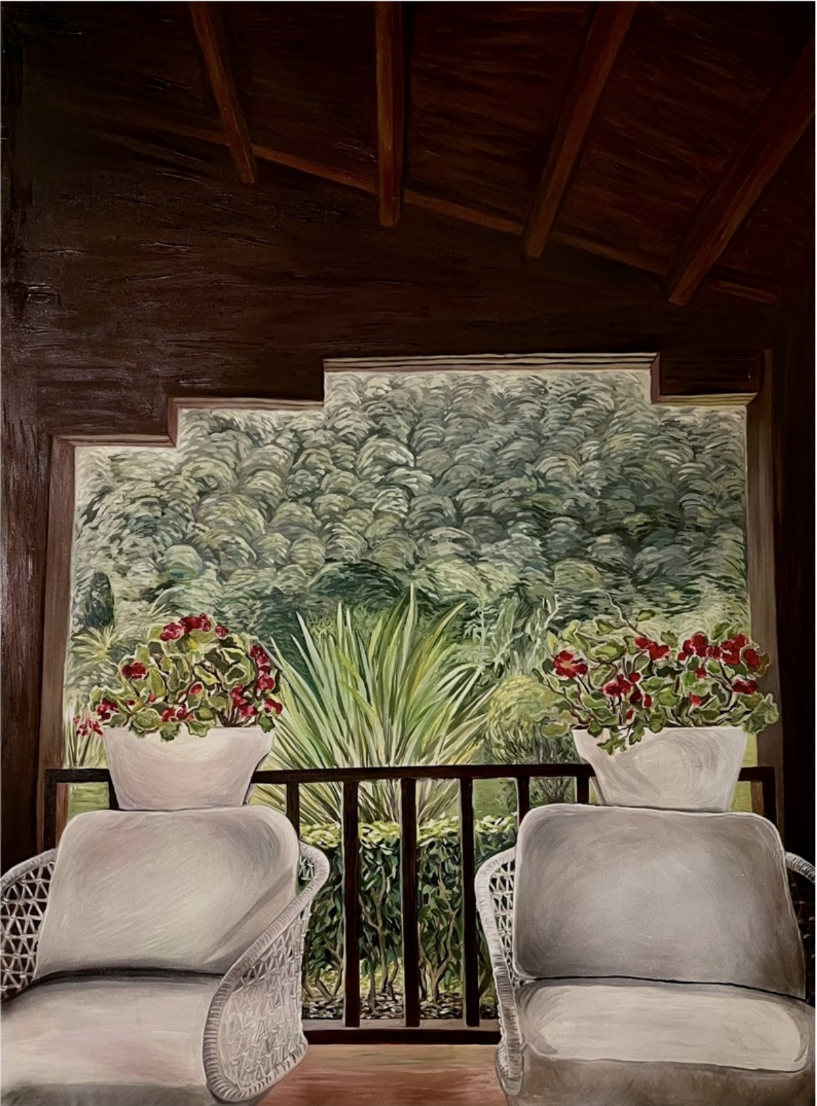
TANNAZ ADLI | UNTITLED | OIL ON CANVAS | 185 * 145 | 2026