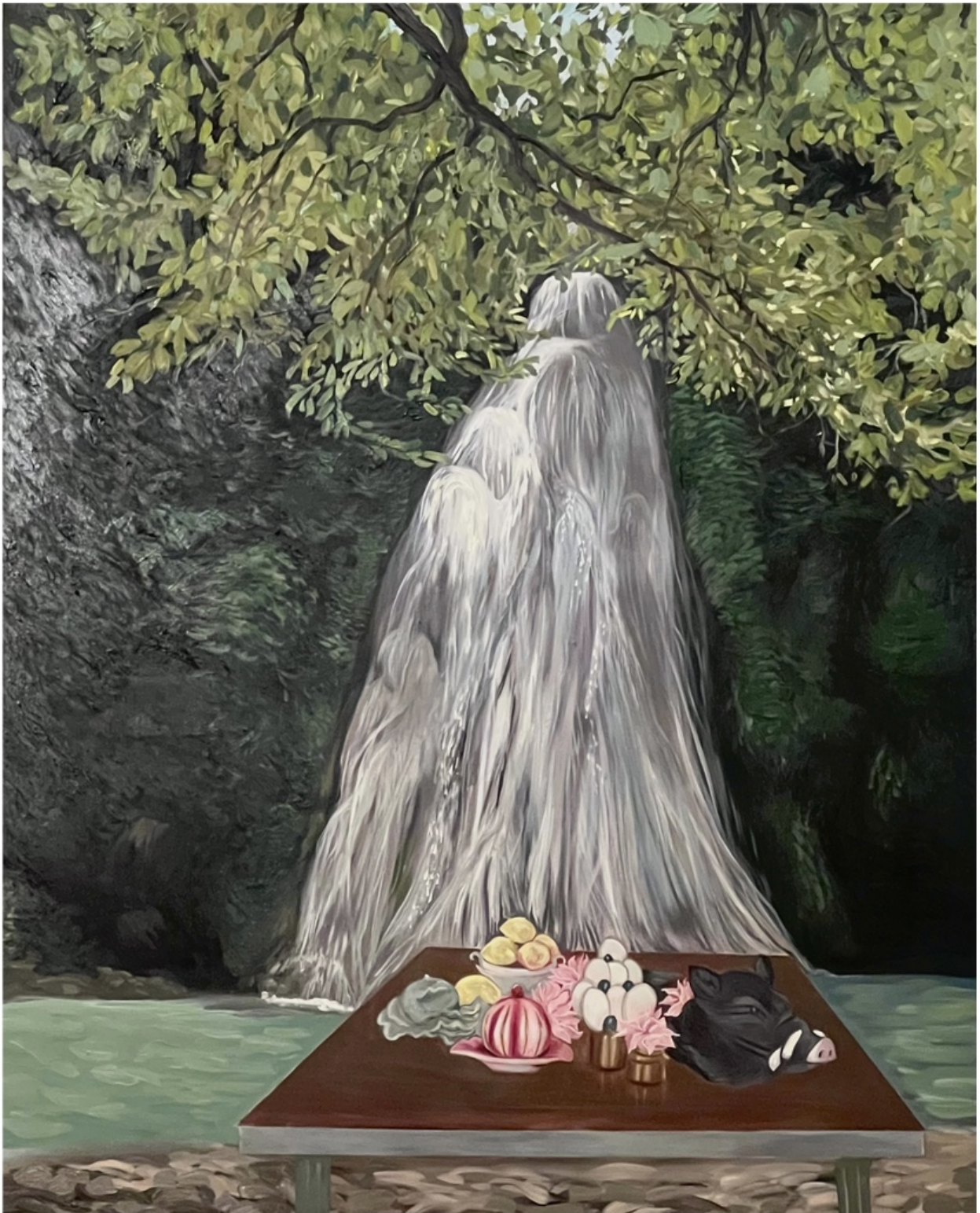
TANNAZ ADLI | UNTITLED | OIL ON CANVAS | 185 * 145 | 2026