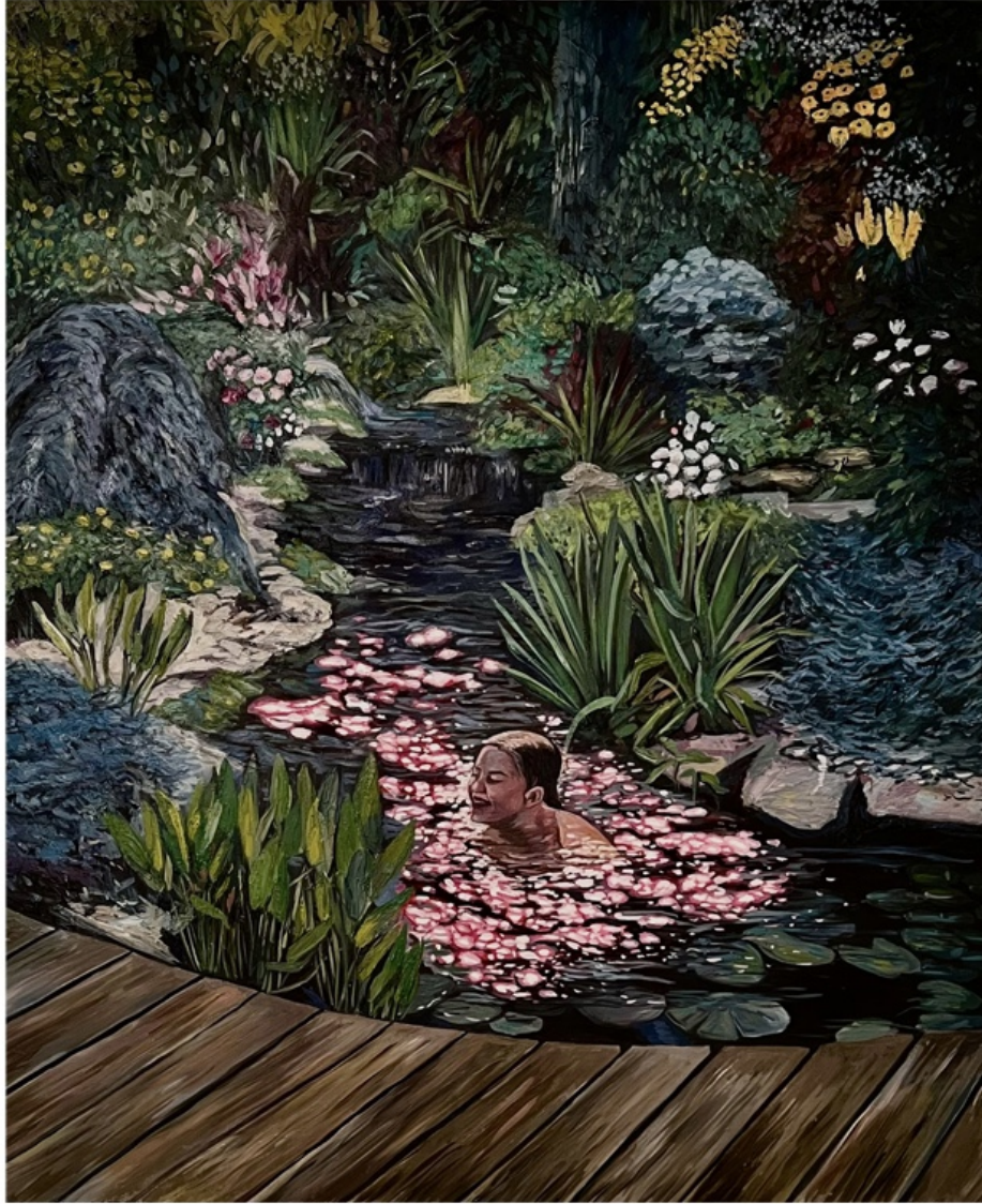
TANNAZ ADLI | UNTITLED | OIL ON CANVAS | 120 * 100 | 2026