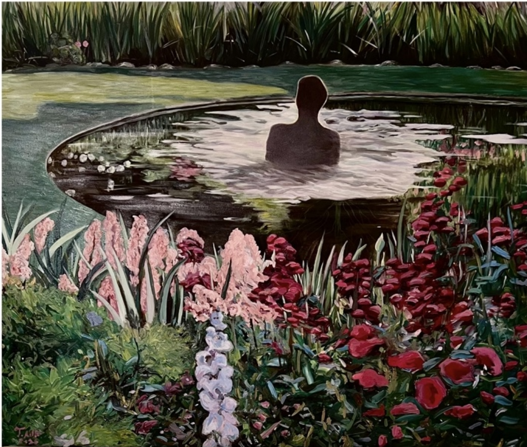
TANNAZ ADLI | UNTITLED | OIL ON CANVAS | 120 * 100 | 2026